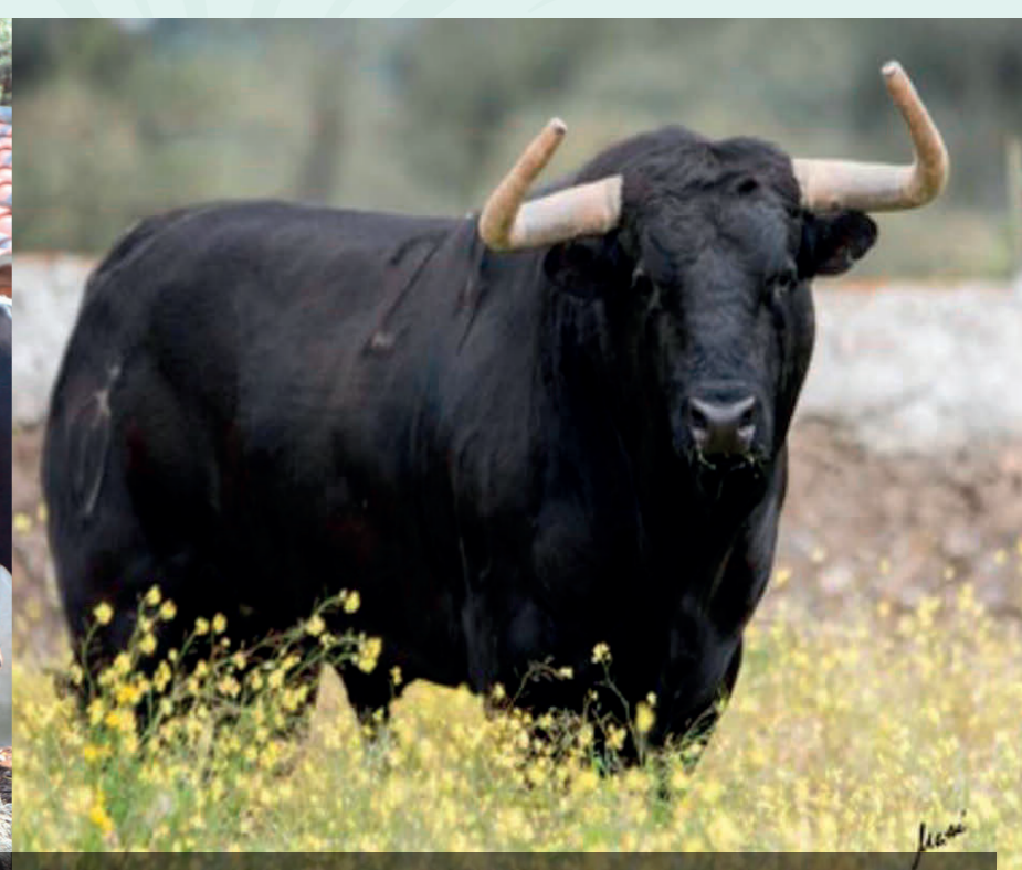
Sábado 31 - "Milagro" Nº 24 G.20