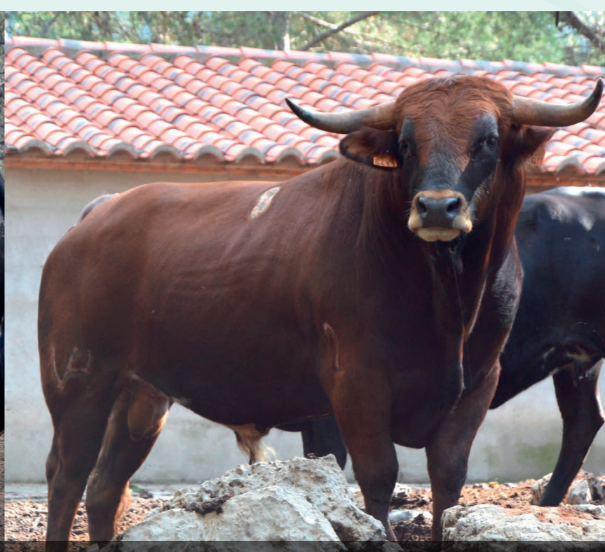
Viernes 30 - "Soldador" Nº 8 G.22